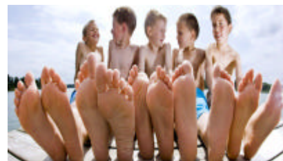
¡ Diversidad !