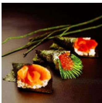
¡ Basura emocional !